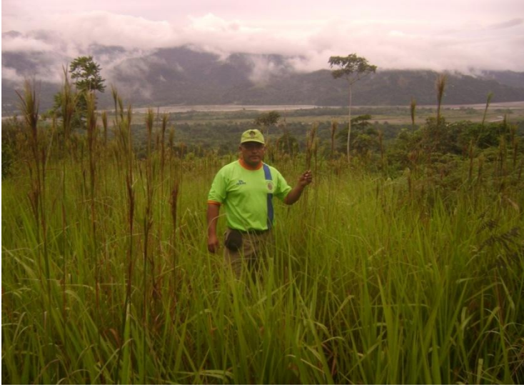
Fotografía N° 01. Parcela agrícola infestada por Andropogon bicornis (rabo de zorro).