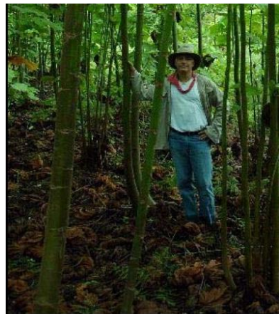
Fotografía N° 01 y 02: Ochroma pyramidale con seis meses de crecimiento (Izquierdo), con un año de crecimiento (Derecha) en parcela dominada por Pteridium aquilinum , México.