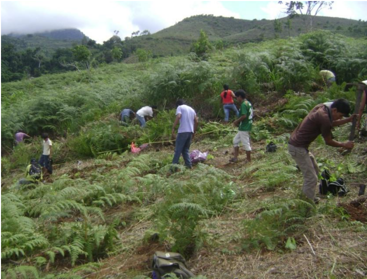
Fotografía N° 02. Parcela agrícola infestada por Pteridium aquilinum (Alpillo). En proceso de plantación con Ochroma pyramidale (Paloto)