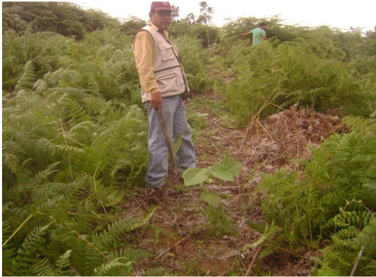
Fotografía N° 03. Manejo de parcela agrícola después de la plantación de Ochroma pyramidale (Paloto).